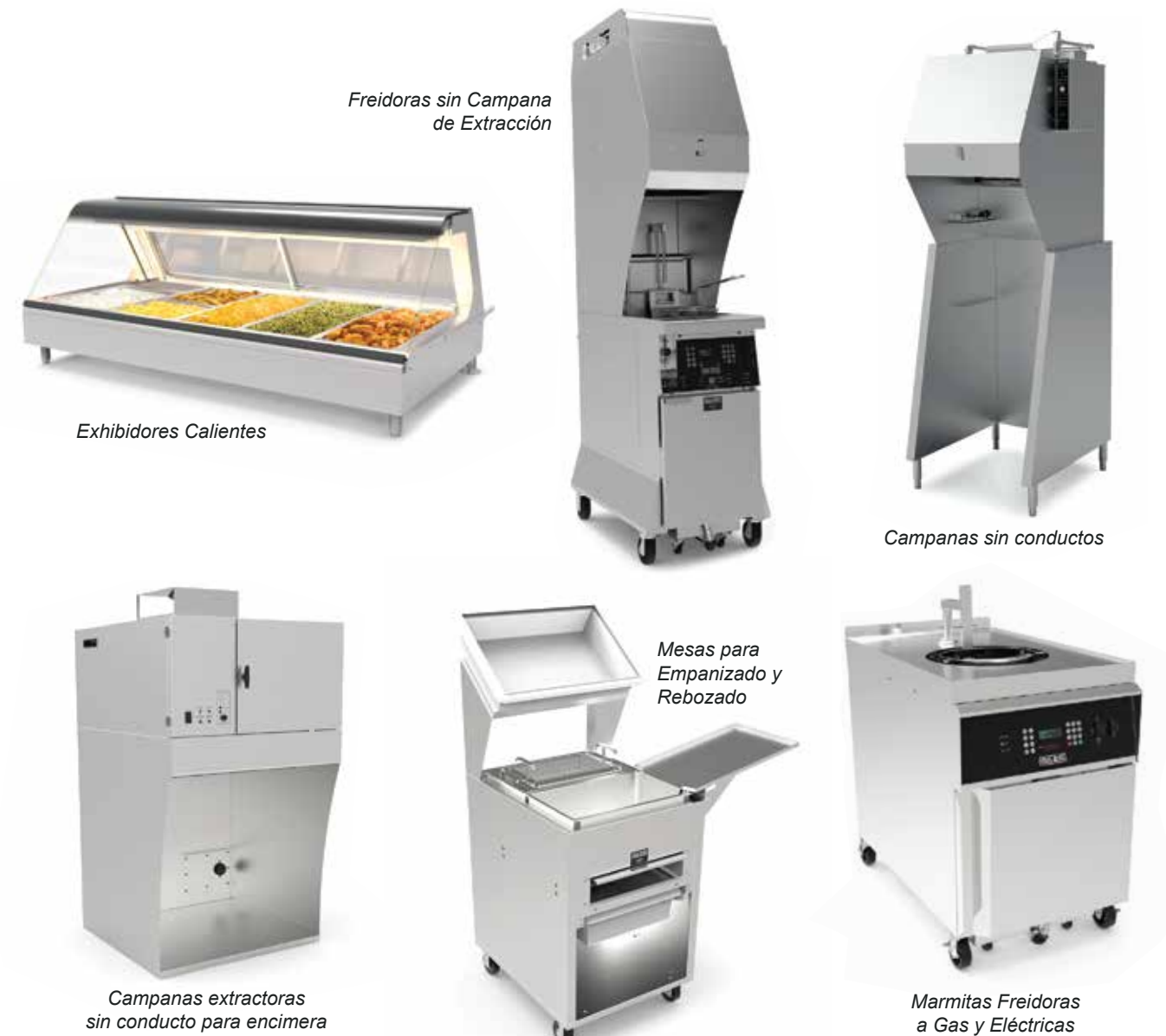
Freidoras sin Campana de Extracción

Con Giles, nuestros clientes pueden ofrecer alimentos de alta calidad, manejar picos de demanda y operar con mayor rentabilidad y menor tiempo de inactividad.